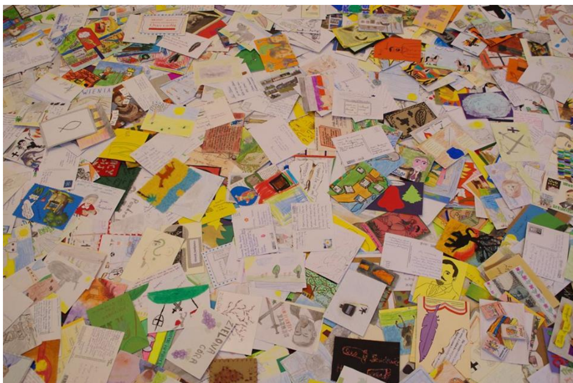
Prace nadesłane przez uczestników akcji Pocztówka do Pana Sienkiewicza.

Pozostając pod wielkim wrażeniem wszystkich podjętych w związku z upamiętnieniem Sienkiewicza aktywności, składamy wyrazy uznania i podziękowania tym, którzy zechcieli wziąć udział w zaproponowanej przez nas akcji, a także we wszystkich wydarzeniach ją poprzedzających.