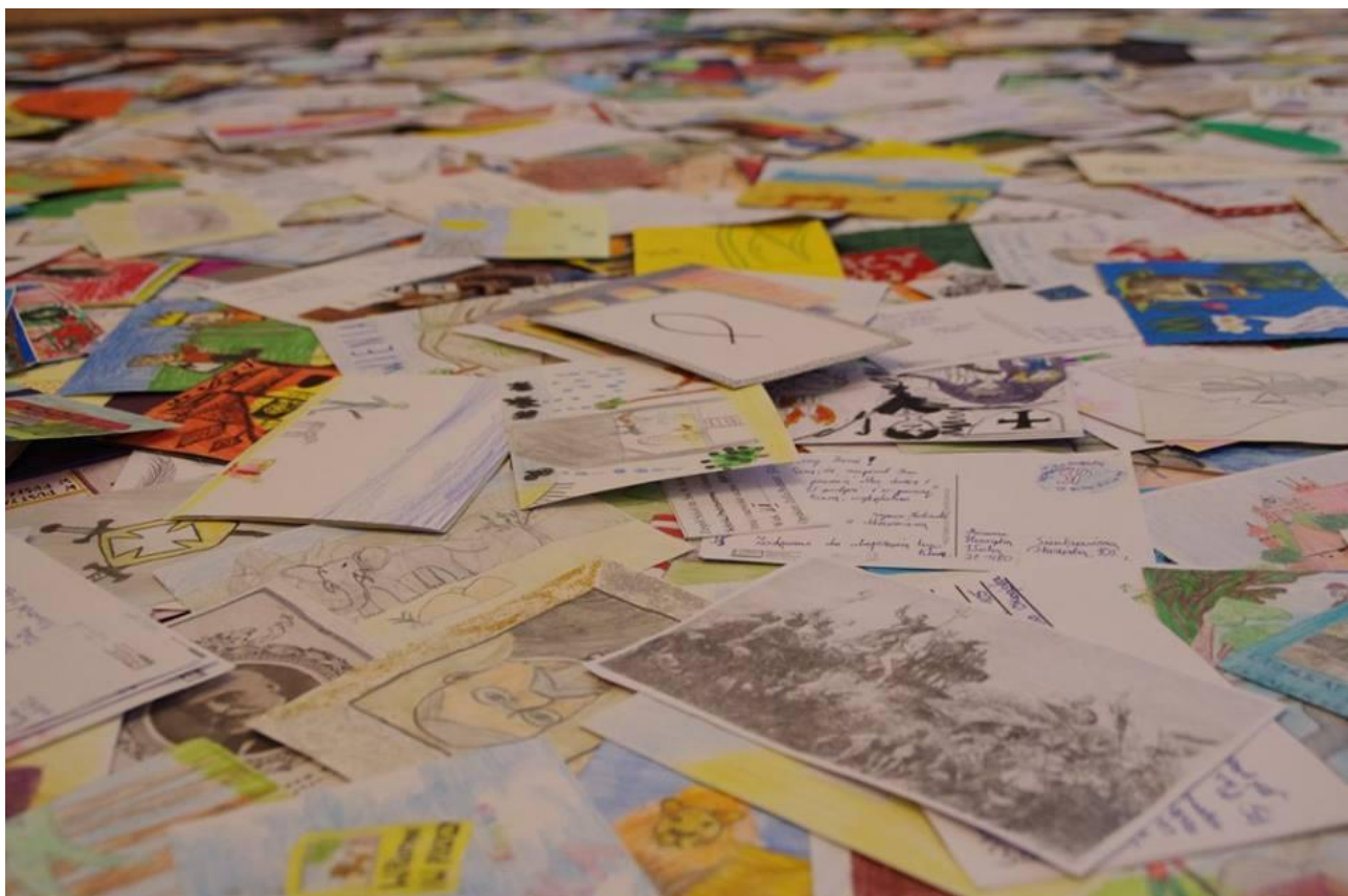
Prace nadesłane przez uczestników akcji Pocztówka do Pana Sienkiewicza .

Przez niemal trzy miesiące swoje uczestnictwo w Pocztówce... zgłosiło 150 różnych placówek z terenu całego kraju – miast, miasteczek i wsi. Z informacji, które napłynęły od 175 nauczycieli i opiekunów wynika, że w tworzeniu sienkiewiczowskich kart pocztowych udział wzięło 3000 osób w różnym wieku – od kilkuletnich dzieci, które wspierali rodzice, aż po dorosłych już uczniów szkół ponadgimnazjalnych. Zadeklarowali oni przesłanie do Woli Okrzejskiej 2655 prac. Ostateczna liczba pocztówek pozostaje jednak tajemnicą... wszakże rejestracja uczestnictwa pozostawała sprawą dowolną.