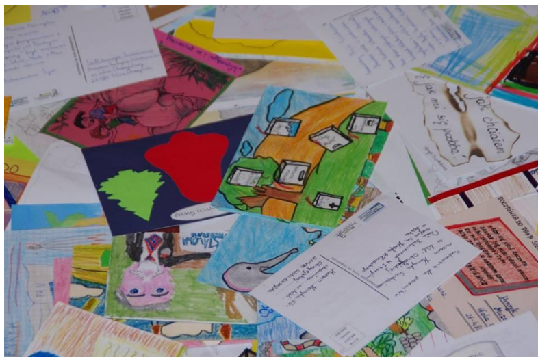
Prace nadesłane przez uczestników akcji Pocztówka do Pana Sienkiewicza.

Pozostając pod wielkim wrażeniem wszystkich podjętych w związku z upamiętnieniem Sienkiewicza aktywności, składamy wyrazy uznania i podziękowania tym, którzy zechcieli wziąć udział w zaproponowanej przez nas akcji, a także we wszystkich wydarzeniach ją poprzedzających.