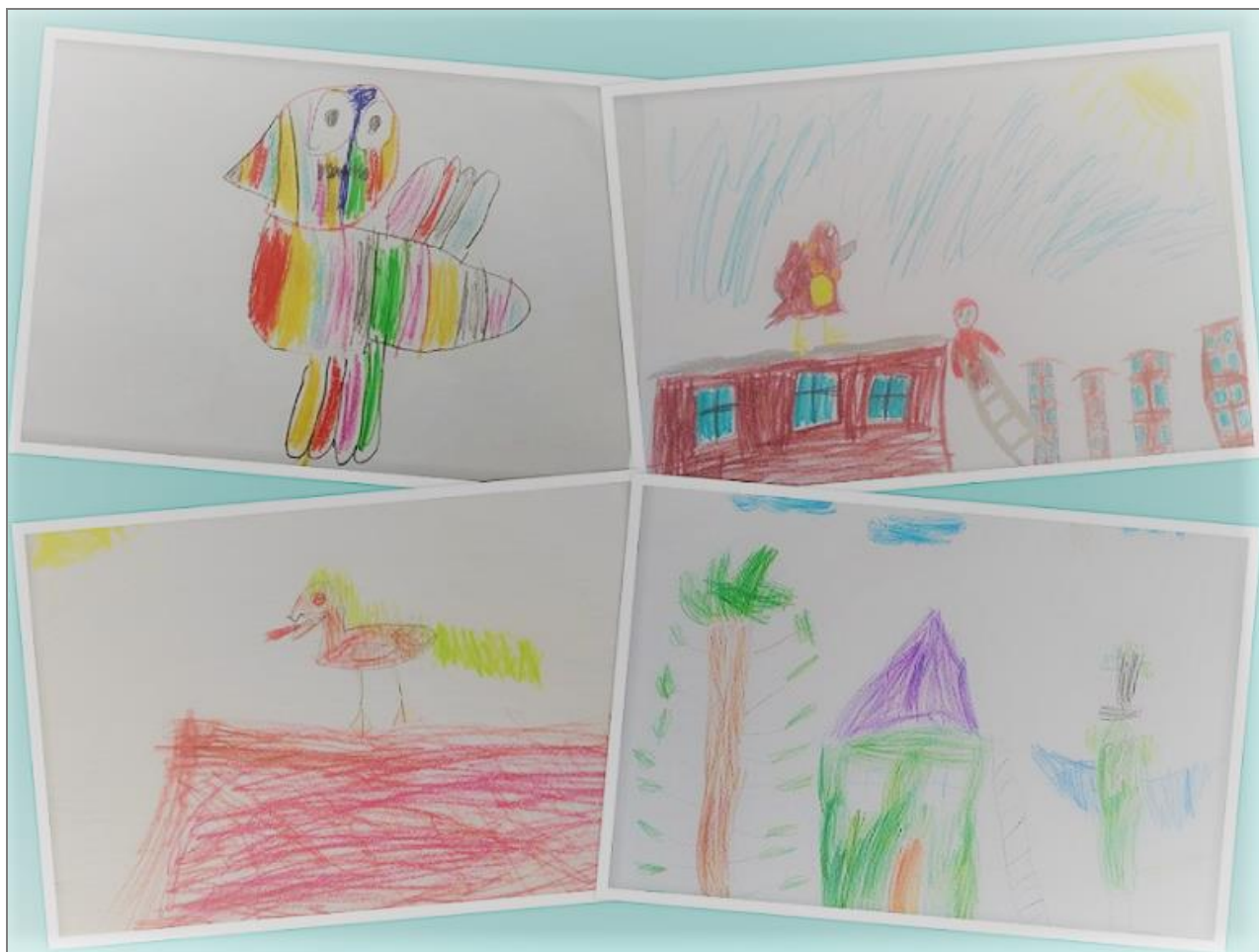
Przykładowe prace narysowane przez uczestników zajęć online.